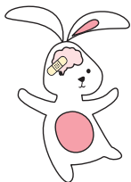
Neurologische schade, leermoeilijkheden

1 op 5 overlevenden kan ernstige gevolgen ondervinden: 1,2,3